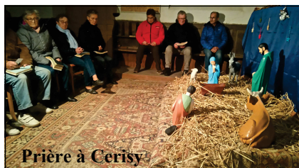
Prière à Cerisy

Depuis quelques années, pendant l'Avent, des chrétiens se retrouvent chaque mardi soir à 18h devant la crèche d'une église de la paroisse pour un temps de prière, de lectures bibliques et de chants. Ceci afin de « faire vivre » nos églises autrement qu'à l'occasion des inhumations ou de la messe dominicale du 1 er dimanche du mois (qui a toujours lieu ailleurs qu'à La Lande-Patry).